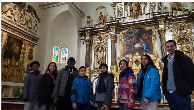
Les ados de la paroisse

Toutes ces activités ont pu être accomplies grâce à votre soutien, c'est pourquoi le groupe des ados vous remercie de votre support !